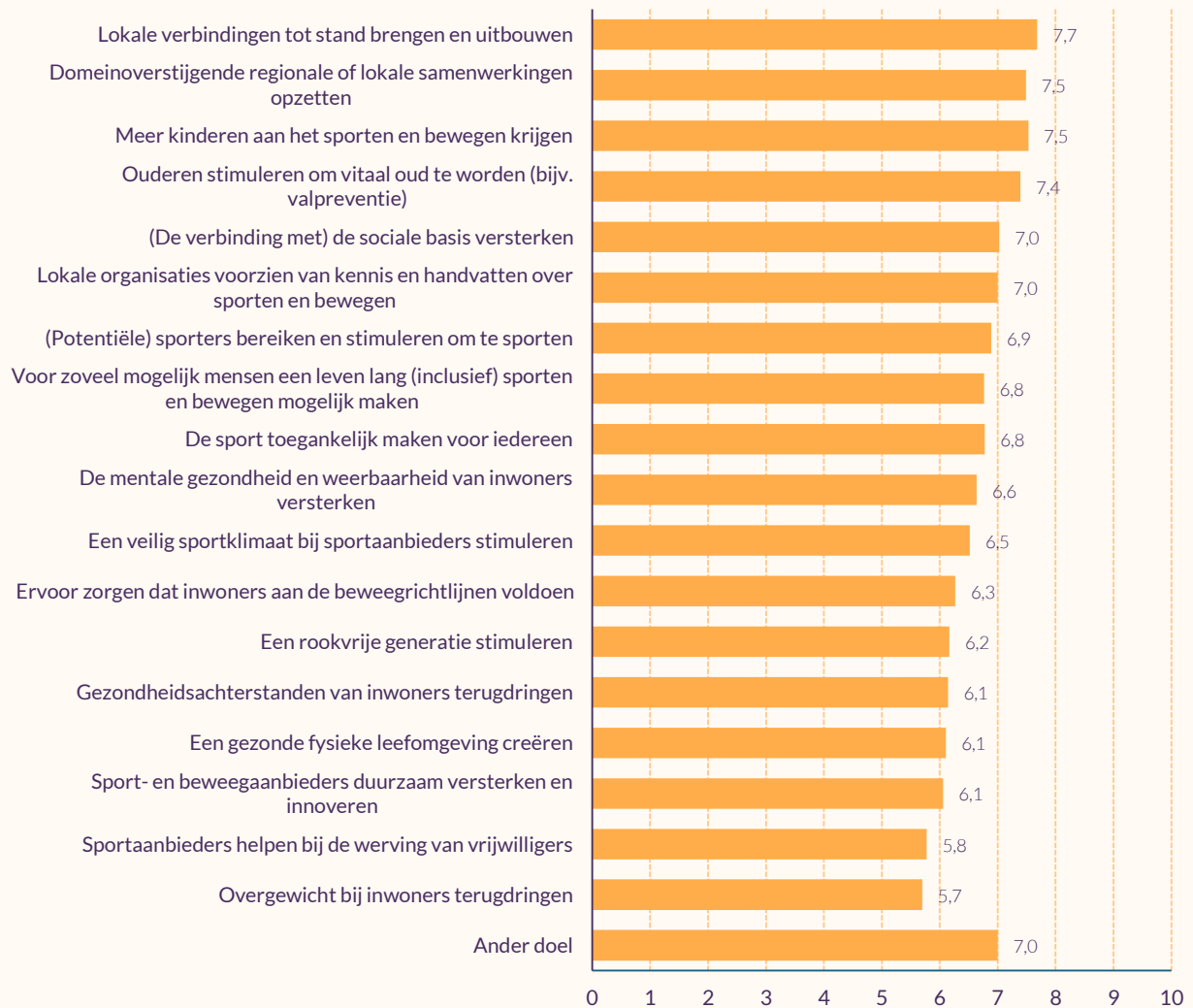
Figuur 4.1 Resultaten* geboekt op de doelen (volgens buurtsportcoaches) (gemiddelden, n=74)

In de panelpeiling hebben we buurtsportcoaches gevraagd naar het resultaat dat zij hebben geboekt op de eerder genoemde doelen (figuur 4.1).