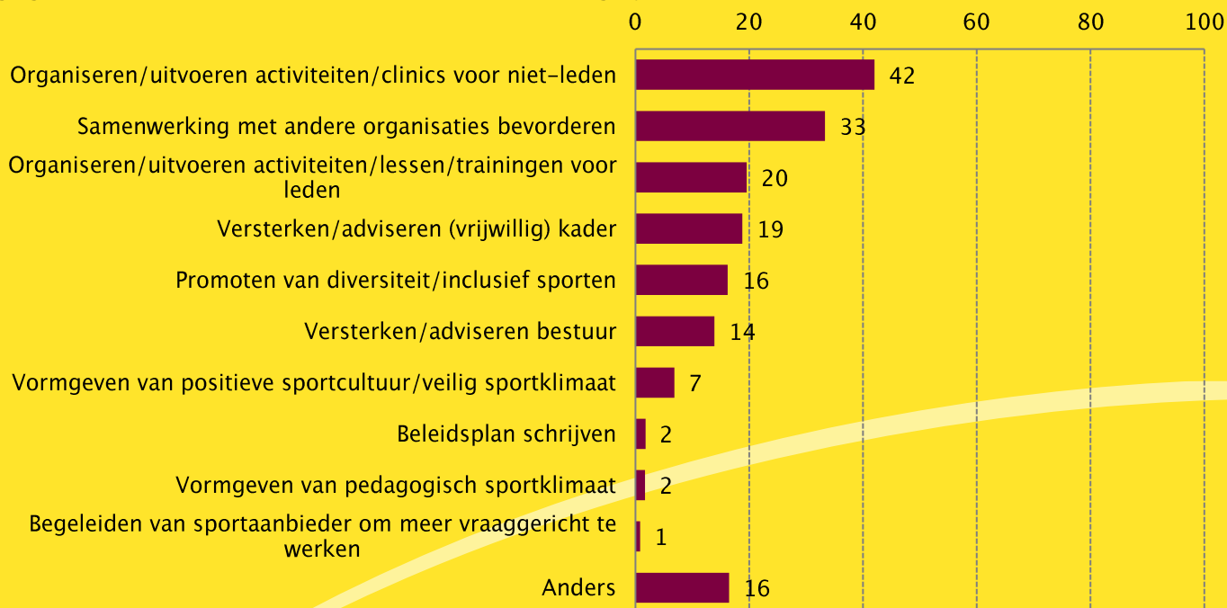
Figuur 1. Taken van de buurtsportcoach in en/of voor de verenigingen tussen juni 2020 en juni 2021 volgens verenigingsbestuurders (in procenten, meerdere antwoorden mogelijk, n=109)