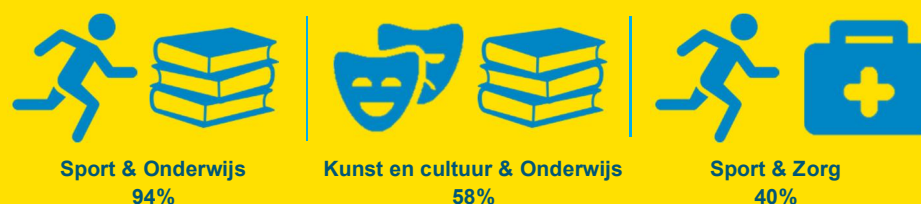
Figuur 2 Percentage gemeenten waarin buurtsportcoaches in genoemde sectorencombinatie actief zijn (top-3, in procenten)