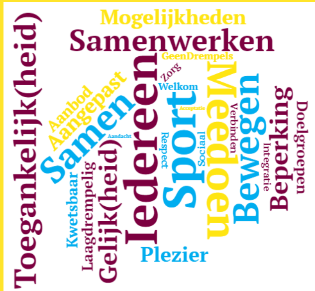
Figuur 1. Associaties bij een inclusieve samenleving: 25 meest genoemde woorden door buurtsportcoaches (520 woorden, n=104)

*Incorrecte antwoorden niet meegenomen