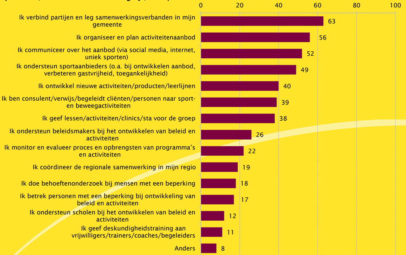
Figuur 3. Activiteiten van buurtsportcoaches voor (inclusief) sporten en bewegen voor personen met een beperking (in procenten, meerdere antwoorden mogelijk, n=104)