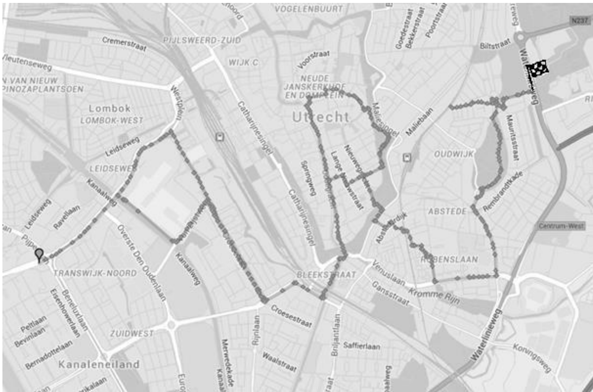
'Art', gerend door Matthijs Beerepoot, in Utrecht (15,5 km, 9 maart 2016).

Langs Utrechtse musea, Het stadion en de Dom, Liep ik op mijn hardloopschoenen En keerde niet meer om.