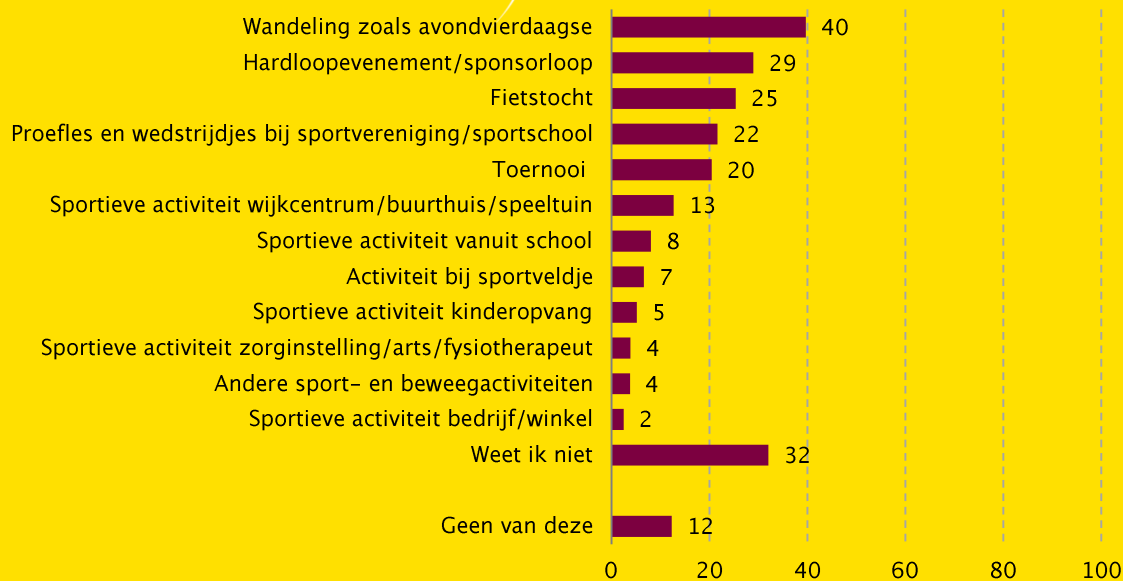
Figuur 1 Bekendheid van sport- en beweegactiviteiten in of vanuit de buurt in de afgelopen twaalf maanden, bevolking 16–80 jaar, meting 2016 (in procenten, n=1.578)