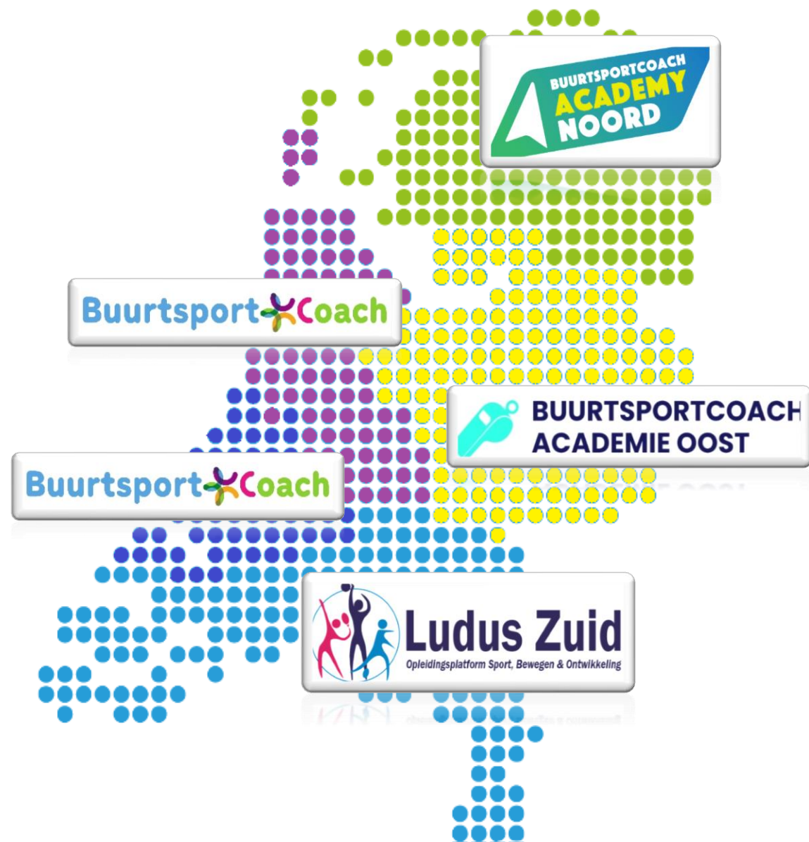
Figuur 1: Regionale academies vanuit de regionale samenwerkingsverbanden